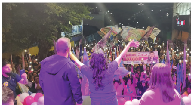
Adilson Santos/ÂNGULO PRODUÇÕES

As pessoas têm noção do que foi feito nos últimos quatro anos. É provável que reconheçam isso nas urnas.