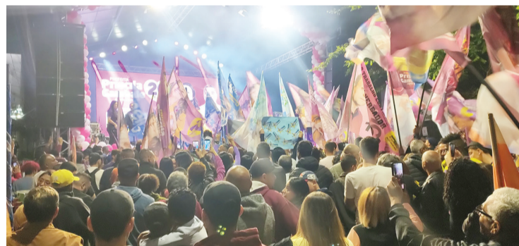
Adilson Santos/ÂNGULO PRODUÇÕES