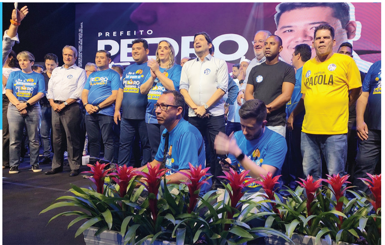
Adilson Santos/ÂNGULO PRODUÇÕES