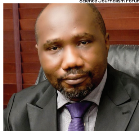
O médico nigeriano Dimie Ogoine , que alertou o mundo sobre a MPox