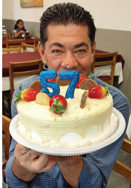
NA 2 - O BOLO