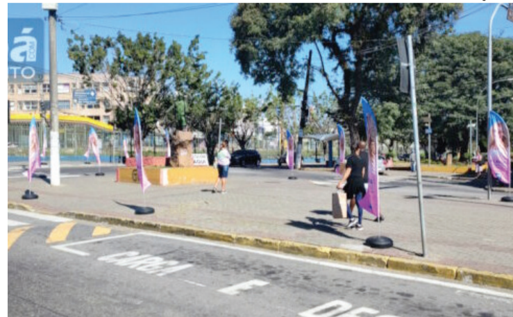
OS BANNERS JÁ ESTÃO HÁ UM MÊS SENDO EXIBIDOS NA REGIÃO CENTRAL

Por outro lado, a justiça eleitoral de Poá determinou a retirada de "windbanners", que a equipe dela já vinha há algum espalhando pelo centro da cidade