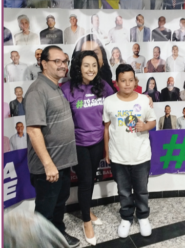
ADILSON SANTOS/Ângulo Produções