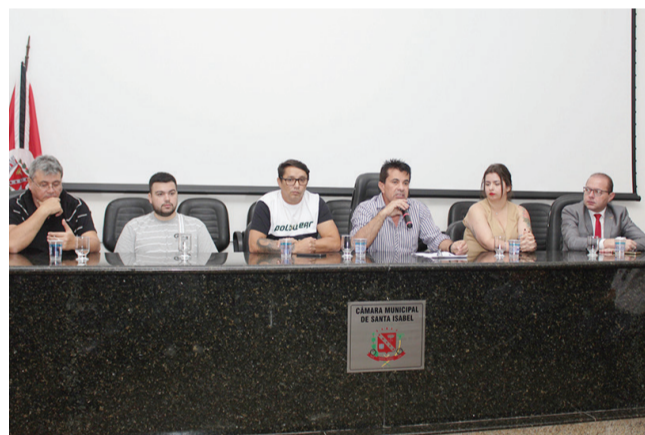
Adilson Santos/Ângulo Produções

PARA O PREFEITO CHINCHILLA, O IPTU PROGRESSIVO E O ICMS AMBIENTAL SÃO DOIS IMPOSTOS IMPORTANTES, POIS GERAM RECEITAS E INDUZEM OS PROPRIETÁRIOS À FAZER MELHORIAS