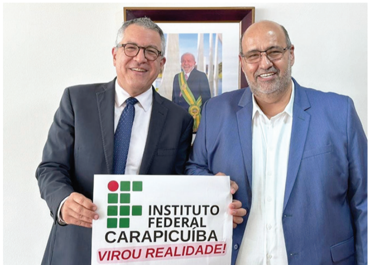
O EX-DEPUTADO JOÃO PAULO CUNHA ESTARÁ NA CAMPANHA