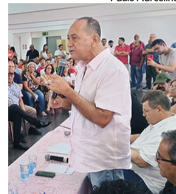
O EX-DEPUTADO JOÃO PAULO CUNHA ESTARÁ NA CAMPANHA