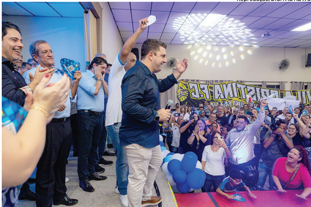
RAFU TROUXE CAQUES DO PL E PREFEITOS DA REGIÃO PARA O LANÇAMENTO DE SUA PRÉ-CANDIDATURA